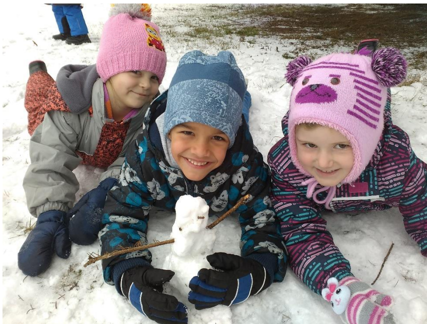
Fouká, fouká, bílá je louka