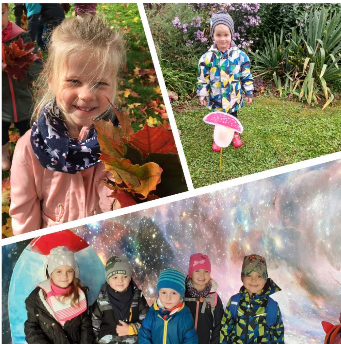
Co vidíme kolem sebe, zajímá to mě i tebe