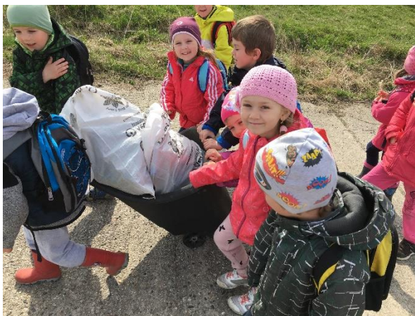
Úklid Naučné přírodovědné stezky