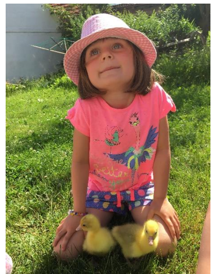
U babičky na dvorku