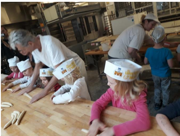
Návštěva soukromé pekárny v Rakousku