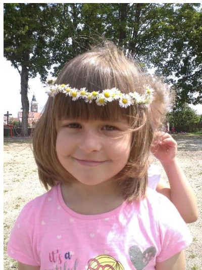
Kvete to, voní to