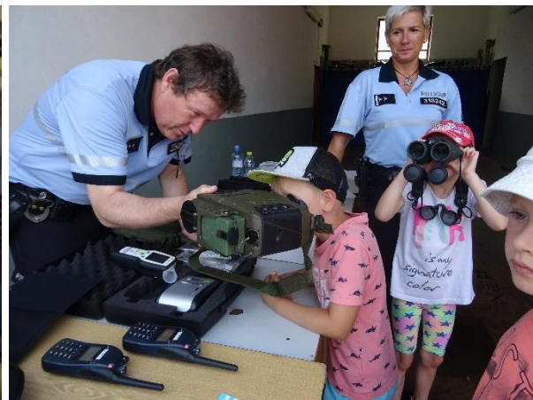
Den pro bezpečí – složky IZS