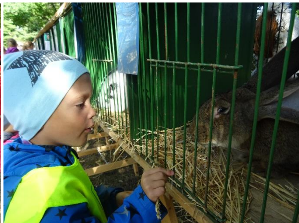
Výstava drobného zvířectva ČSCH