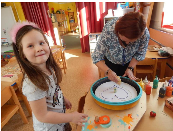
Létající barvy – netradiční technikou děti s rodiči vytvářeli originální trička.

Zařazujeme programy vzdělávacích center, např.: Malá technika z.ú., Český nadační fond pro vydrů Třeboň, Centrum environmentální výchovy PodpoVRCH v Jihlavě, vzdělávací centrum ZOO Hluboká v Hluboké nad Vltavou, Hvězdárna a planetárium prof. Františka Nušla, nezisková organizace ZkusToZdrave.