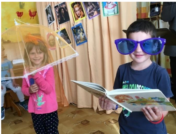
Z pohádky do pohádky Hudebně vzdělávací program

Jednotlivé klasické, autorské pohádky, pohádky o zvířatech (bajky) – volba pohádek odpovídá věku dětí, vychází z jejich potřeb a zájmů, z aktuální situace nebo problémů, které můžeme pomocí pohádky řešit.