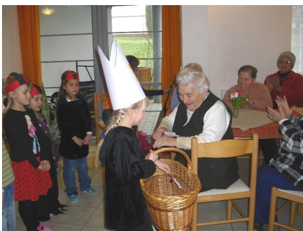
Čerti seniorům zaspívali a zatančili, Mikuláš rozdával nadílku.