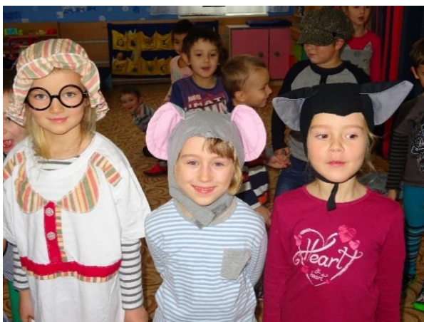
O veliké řepě Hrajeme pohádky pro kamarády ve školce