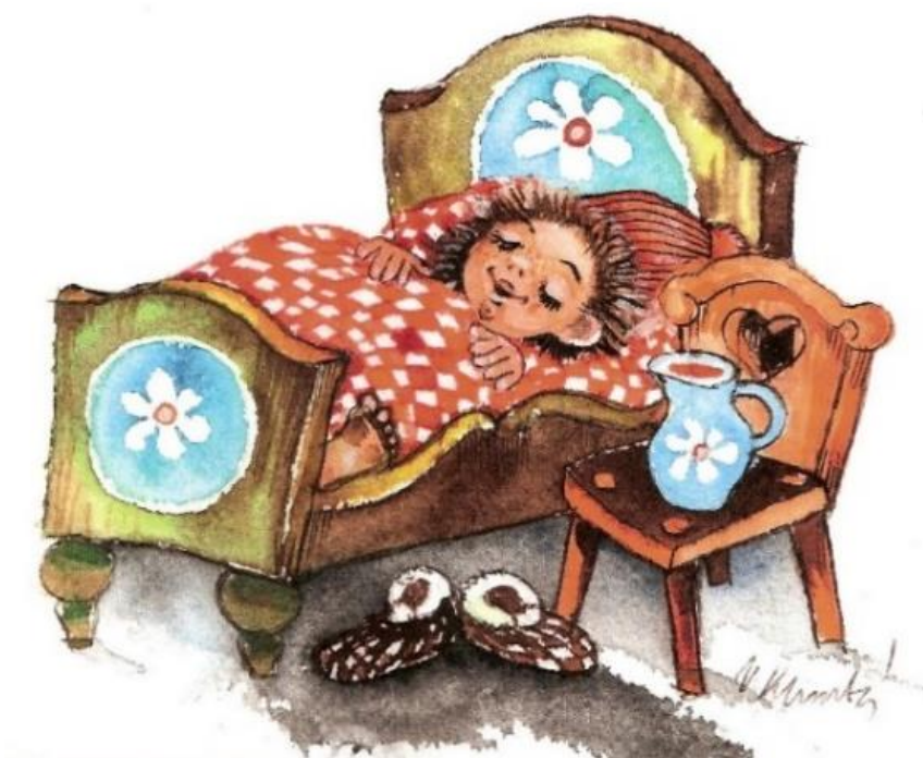
O skřítkovi Heřmánkovi

Uvedené hry a činnosti bývají v mateřských školách běžně používány. Většinu z nich můžeme ve své pedagogické práci využít s různými obměnami a v různých kontextech.