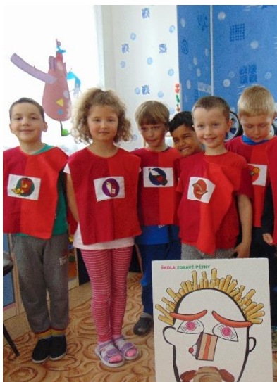
Hrátky Zdravé 5

Kdo jsem Mé tělo; Myšlení nebolí Jdeme k lékaři Proč někdy stonáme Rosteme zdravě Mé pocity Našich pět smyslů Sportem ke zdraví Co děláme celý den atd.