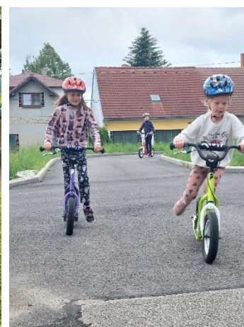
Šlapu si to na kole