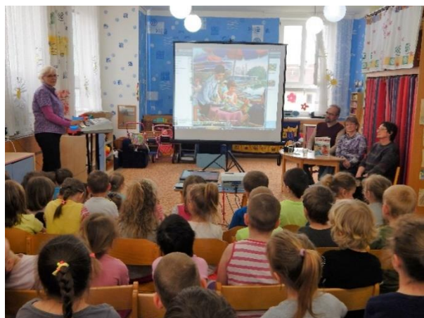
Čtecí vlak – čtení s promítáním Setkávání nejstarší a nejmladší generace