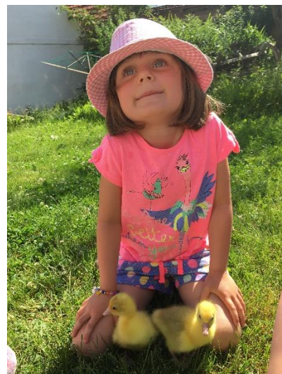
Jaro na dvorku