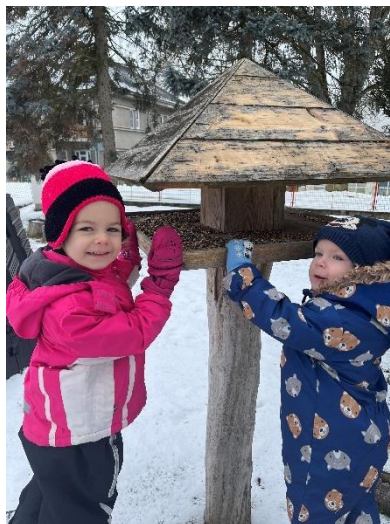
Hosté u našich krmítek