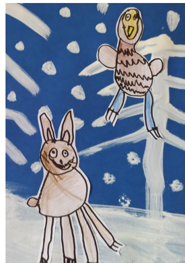
Stopy zimního života