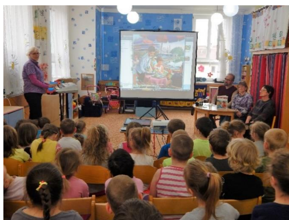
Čtecí vlak – čtení s promítáním Setkávání nejstarší a nejmladší generace