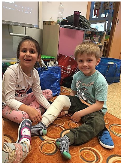
Staň se hrdinou