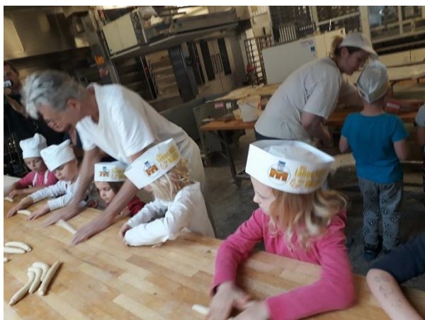
Návštěva soukromé pekárny v Rakousku