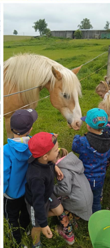
Hrajeme si venku; Co se děje v trávě