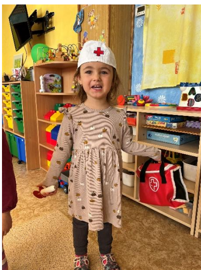
Proč někdy stonáme

Moje tělo Rosteme zdravě Proč někdy stonáme Mé pocity Našich pět smyslů Sportem ke zdraví Zdravověda žádná věda Zachraň kamaráda atd.