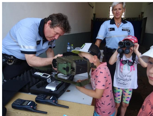
Den pro bezpečí – složky IZS