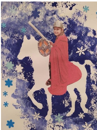
Svatý Martin jede