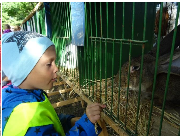
Výstava drobného zvířectva ČSCH