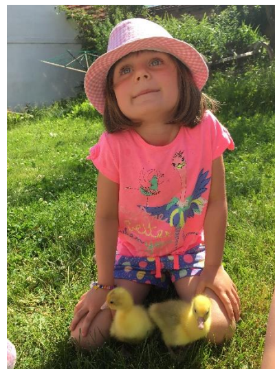
Jaro na dvorku