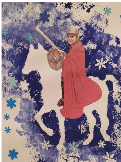
Svatý Martin jede